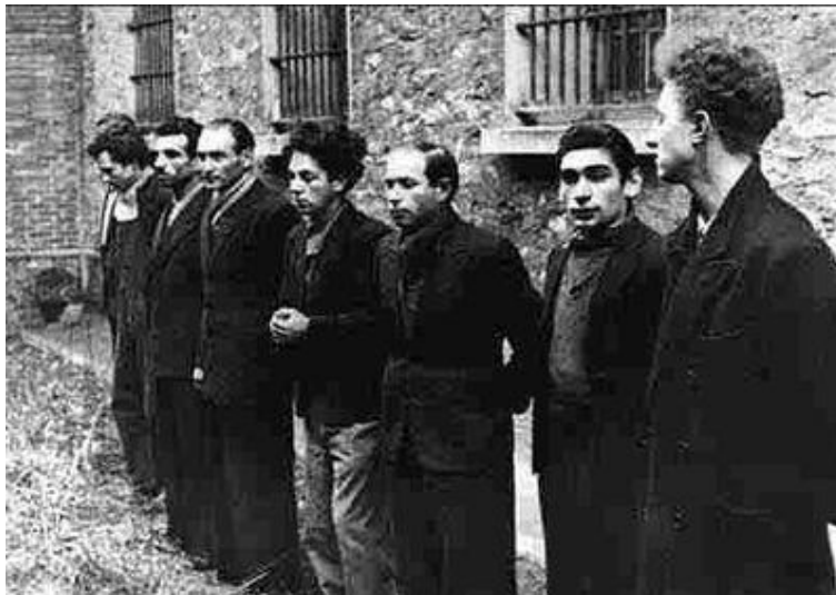
Photo des membres du groupe Manouchian à la prison de Fresnes.

Le 15 février 1944 s'ouvrit à Paris, devant le tribunal militaire allemand, le procès de vingt-trois membres du groupe dirigé par Missak Manouchian.